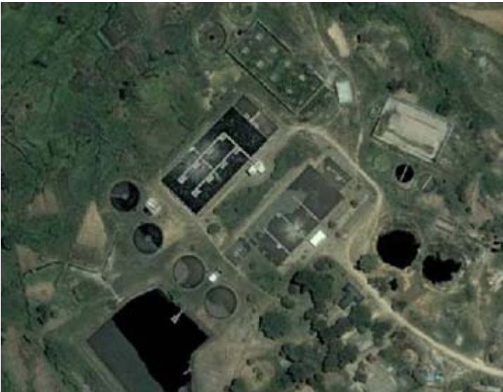
Station d'épuration installée au Zimbabwe

Rodney Lanser, ingénieur électromécanique Veolia Water Solutions (Pittsburg, Etats-Unis)