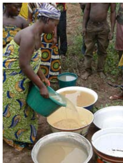
La situation actuelle à Bohicon

Ces éléments permettront de faire de ce projet d'adduction d'eau un candidat au soutien financier de la Fondation Veolia. Il sera présenté lors d'un prochain comité de sélection de la Fondation pour compléter le mécénat de compétences par une enveloppe financière.