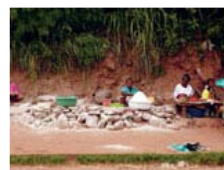
L'article paru dans Planète.

Selon une même approche qu'en République Démocratique du Congo, des études épidémiologiques et des études sur l'accès à l'eau, l'assainissement et les pratiques d'hygiène ont été menées fin 2010, autour du bassin du Lac Tchad, au Cameroun, Niger, Nigeria et Tchad, par les experts volontaires Veoliaforce ainsi que leurs partenaires de l'université de Franche-Comté, sur demande de l'Unicef. En partenariat avec Action contre la Faim, la Fondation livre actuellement un soutien technique au développement d'un protocole de recherche et d'analyse du Vibrio Cholerae dans l'eau de boisson à N'djamena, au Tchad.